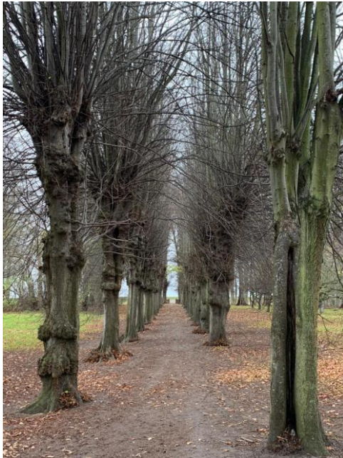
vor dem Baumschnitt

Direkt an der Ostsee befindet sich diese 200 Jahre alte, denkmalgeschützte Lindenallee. Ein Rückschnitt wurde aufgrund des hohen Alters der Bäume und des Gewichtes der Fächer notwendig, um ein Brechen von Ästen und Bäumen zu verhindern und den alten Baumbestand gesund zu erhalten.