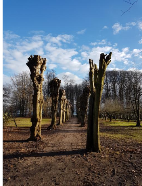
nach dem Baumschnitt

Unser Verein unterstützte diese Maßnahme, die auch vom Landesamt für Denkmalpflege gefördert wurde, mit einem Zuschuss (1.000 Euro).