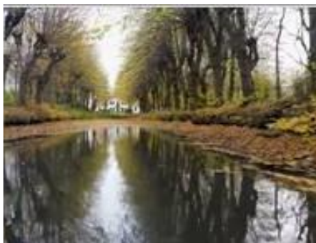
vor der Sanierung

Die 300jährige denkmalgeschützte Linden-Allee auf Gut Seestermühle ist Teil einer barocken Gartenanlage. Nicht weniger als 572 Bäume stehen in Doppelreihe und laufen sehr malerisch auf ein Teehaus zu. Sie wurde 2010 vom Heimatbund Schleswig-Holstein als einer der schönsten Alleen des Landes prämiert. Da sie akut im Bestand bedroht war, bemühte sich ein „Runder Tisch“ unter der Leitung und Koordination des gemeinnützigen Fördervereins KulturLandschaft Pinneberger Baumschul-land e.V. zusammen mit dem Eigentümer um die Finanzierung einer grundlegenden Sanierung. In einer großen Kraftanstrengung ist es gelungen, knapp 200.000 EUR an Fördermitteln zur Durchführung der erforderlichen Baumpflege, von Neupflanzungen und Umweltbildung einzuwerben. Den Löwenanteil von 80.000 EUR hat die BINGO! Umweltlotterie beigesteuert. Unser Verein hat sich dabei mit einem Zuschuss in Höhe von 7.500 Euro beteiligt. 2021 sollen noch weitere Maßnahmen folgen, wie die Freistellung eines Randstreifens und die Entschlammung des Kanals.