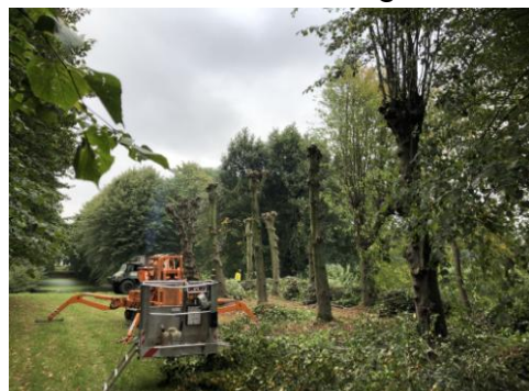
während der Arbeiten

Sehr eindrucksvoll ist ein Video, das während der Arbeiten von einer Drohne aufgenommen worden ist. Sie finden es unter folgendem Link: https://youtu.be/sIC3CXWv-hE .